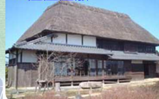
諫早市指定の有形文化財