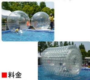
■アクアボール(チューブ)

■料金 アクアボール ※1名様のみ「5分/500円」 アクアチューブ ※1名様「5分/500円」 ※2名様「5分/850円」