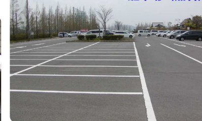
普通車約400台 ・大型バス9台