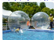
■アクアボール(チューブ)

13880㎡の池を横断する親水性のある池です。スワンボートや手漕ぎボートも楽しめます。